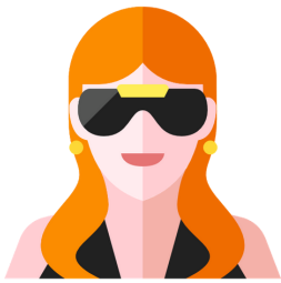
La pija / fresa